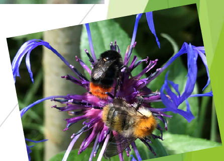
Steinhummel trifft Ackerhummel auf der Bergflockenblume