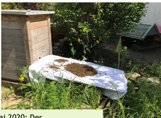
Mai 2020: Der Honigbienschwarm läuft in die Bienenkugel ein.