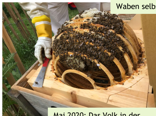
Mai 2020: Das Volk in der Bienenkugel mit der ersten verdeckelten Brut