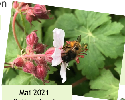
Mai 2021 - Balkanstorchschnabel wird belagert von Hummeln und Mauerbienen