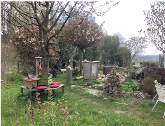
13.04.2021 - Blick auf das Bienendorf