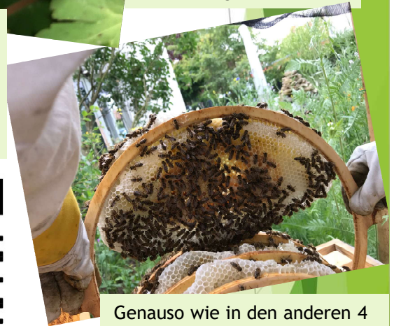
Genauso wie in den anderen 4 Beuten bauen die Bienen ihre Waben selbst.